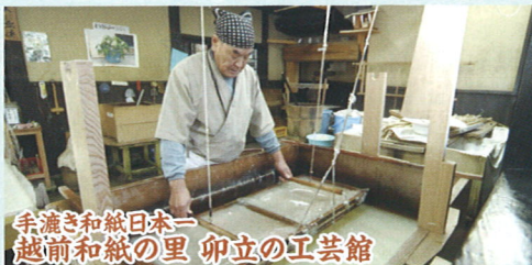
手漉き和紙日本一 越前和紙の里 卯立の工芸館