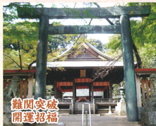
難関突破 開運招福