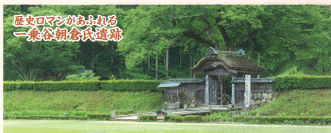
歴史ロマンがあふれる 一乗朝倉氏遺跡