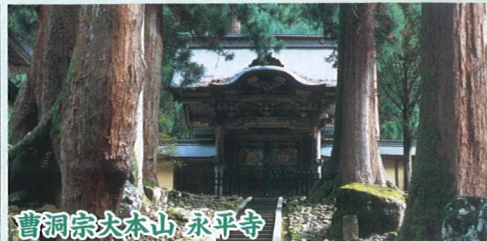
曹洞宗大本山 永平寺