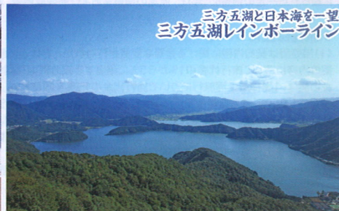
▲大パノラマが楽しめる山頂公園 WCWEWA