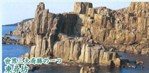
世界三大奇勝の一つ 東尋坊