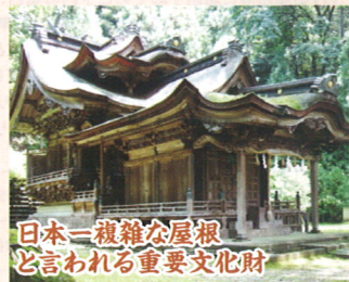
日本一複雑な屋根 と言われる重要文化財